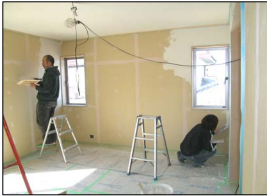
ご夫婦で珪藻土塗りにチャレンジ！