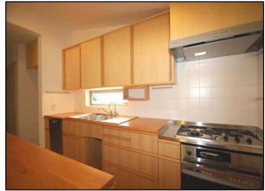
奥様と設計室で考えた手作りキッチン